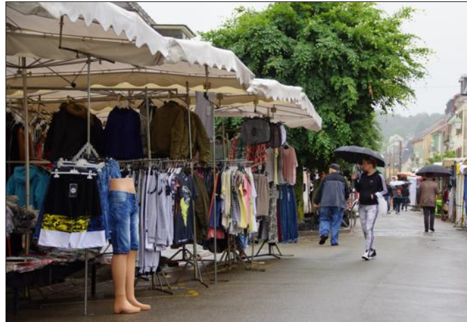
■ Petite affluence, dimanche matin, à la braderie de Delle.

Des 6 h, dimanche, plus d'une centaine de commerçants ambulants s'étaient donné rendez-vous à la braderie, organisée par l'association les Vitrines de Delle-Joncherey et Grandvillars.