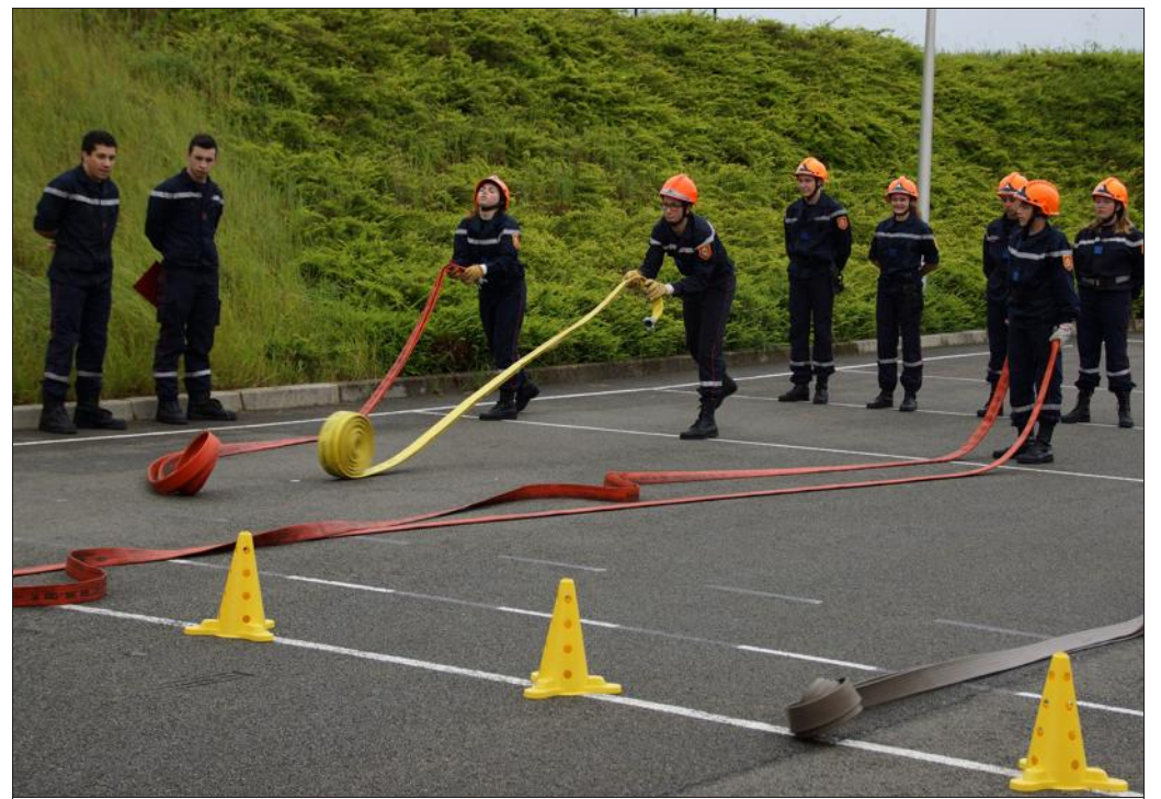
■ L'épreuve de manœuvre des tuyaux chez les JSP.