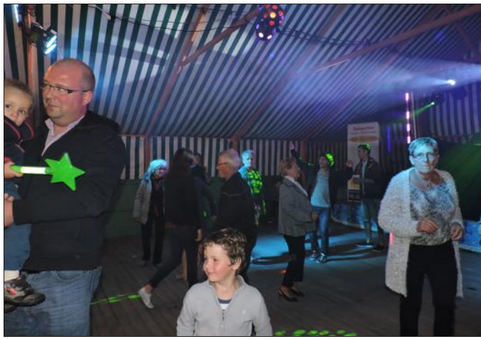
■ Sur la piste de danse

Mercredi soir, sous le chapiteau installé sur le parking du Cercle à Rougemont, l'association Culture et Animations a organisé les festivités du 14-Juillet. Une équipe d'une cinquantaine de bénévoles a permis la réussite de cette soirée. Des repas ont été servis dans la salle du Cercle. L'harmonie de Rougemont est venue jouer au moment de l'apéro, puis a laissé la place au disco, pour