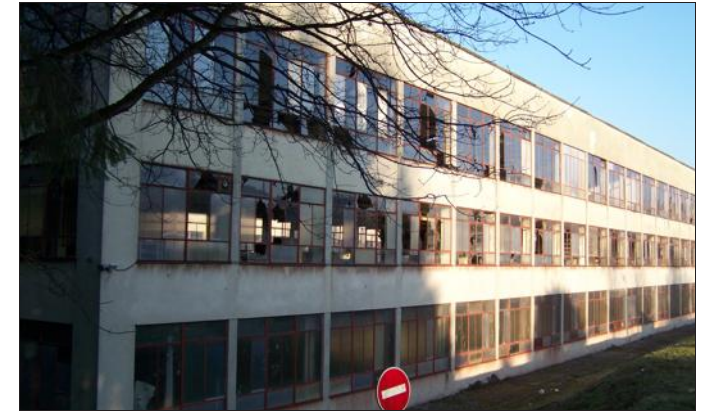
■ Après leur acquisition par la Ville, les longs bâtiments industriels ont été rapidement démolis.

Un projet d'agrandissement de la Maison Belot voit le jour :