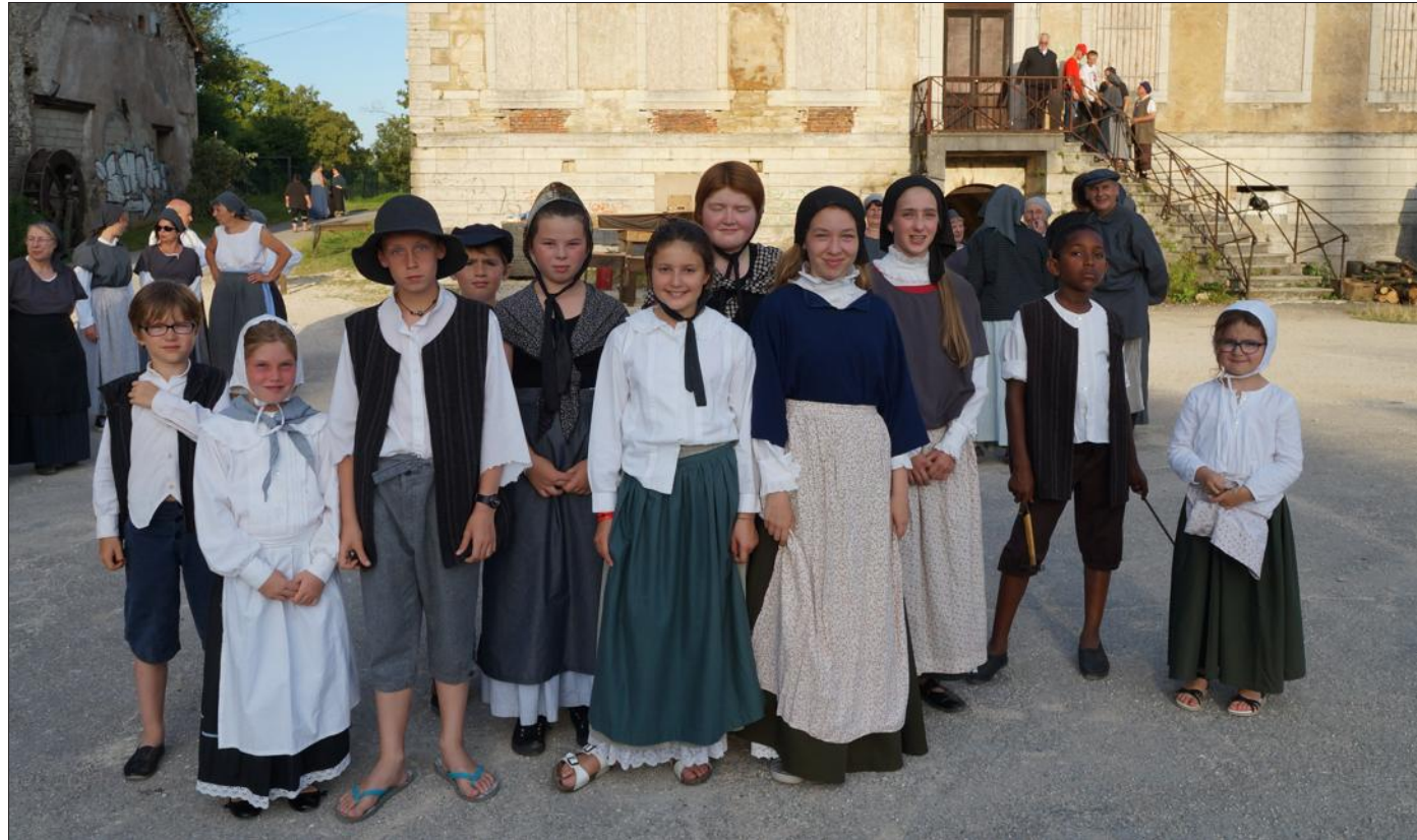
■ Les enfants, très présents pour ce 30 e sons et lumières.

Ce lundi avait lieu la 10 e et dernière répétition avant la générale de mercredi soir et les trois journées de représentation suivantes pour ce 30 e sons et lumières de l'association Vivre Ensemble de Brebotte. Lors de ce week-end, beaucoup de choses ont été mises en place ; à savoir la tribune de 950 places numérotées dès vendredi grâce à la contribution de nombreux bénévoles, la sono qui diffusera un son en 5.1 rendu possible avec l'apport technique de