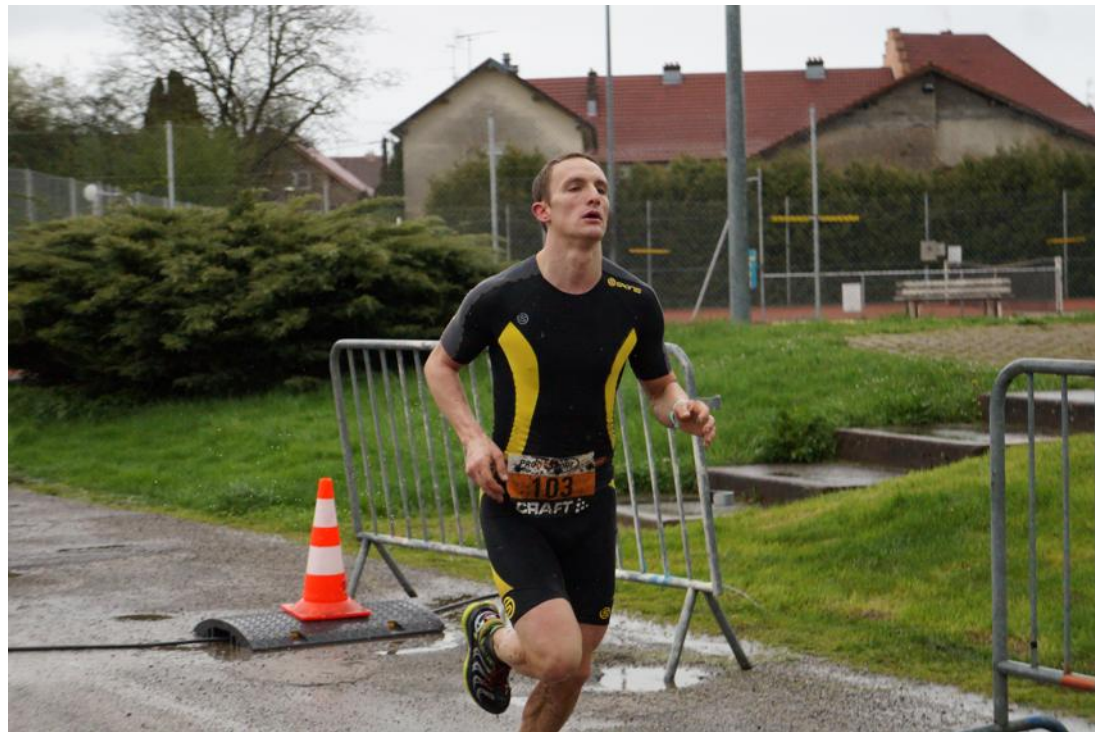
La course à pied reprend ses droits à Grandvillars.

On peut également s'y inscrire dès maintenant pour le 30 septembre. Les organisateurs espèrent, en faisant découvrir les parcours de cette future épreuve d'envergure régionale, attirer du