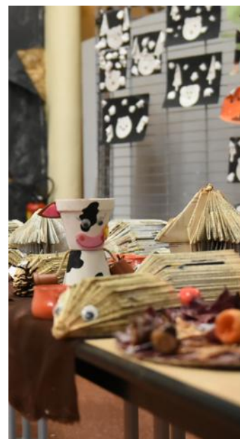
Une partie objets confectionnés par les enfants.

Les TAP s'arrêteront officiellement le vendredi 6 juillet prochain.