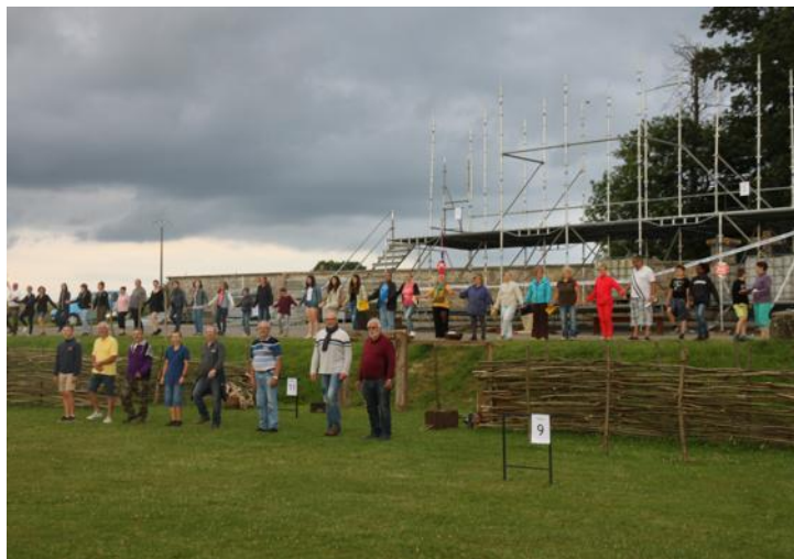
Tous ensemble à la sixième répétition.

La sixième répétition du son et lumière des bénévoles de l'association Vivre Ensemble a eu lieu dernièrement. De nouveaux talents rejoignent les plus expérimentés et chacun trouve sa place pour une mise en scène étonnante.